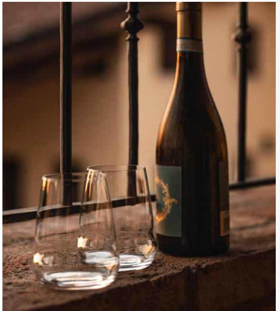
Verre à vin rouge Verre à vin blanc