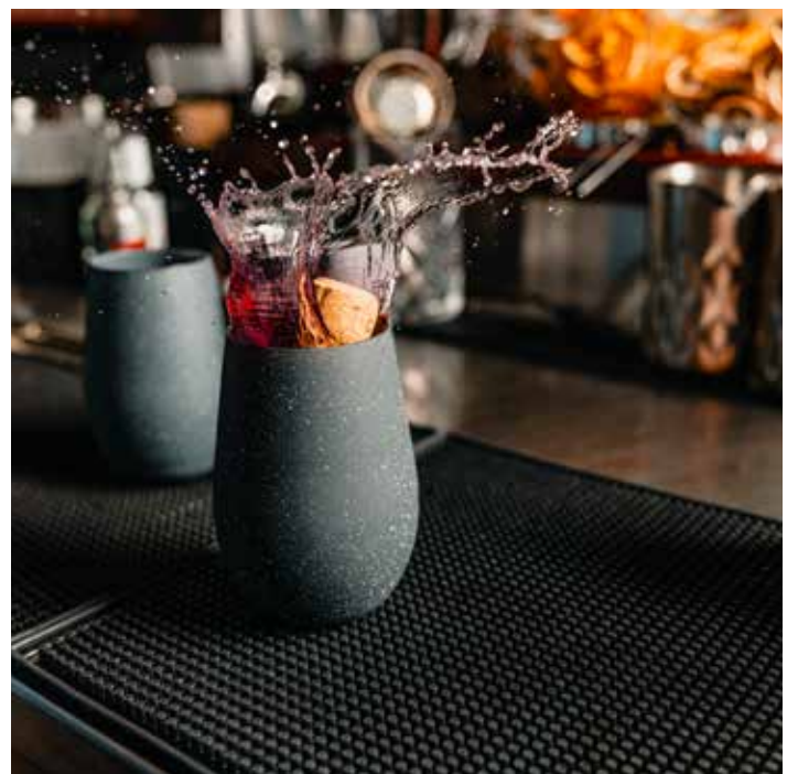
Basalte (gris foncé)