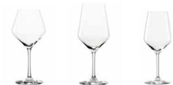
377 00 00 Bourgogne 545 ml H 220 mm Ø 107 mm € 38,96

De cette manière, une sélection concentrée de verres a été créée, convaincante dans son aptitude pour les boissons et son langage de design. Cela signifie qu'avec un nombre gérable de verres, vous êtes équipé pour chaque situation.