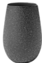
352 00 12 SN152 Basalte (gris foncé) 465 ml H 120 mm Ø 85 mm € 53,54