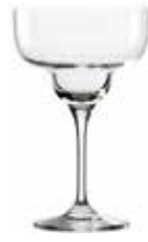
140 00 24* Grandezza Margarita 340 ml H 172 mm Ø 111 mm € 47,30