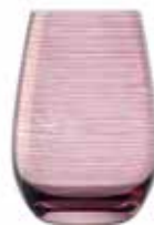
352 00 12 TW013 Lilas 465 ml H 120 mm Ø 85 mm € 47,92