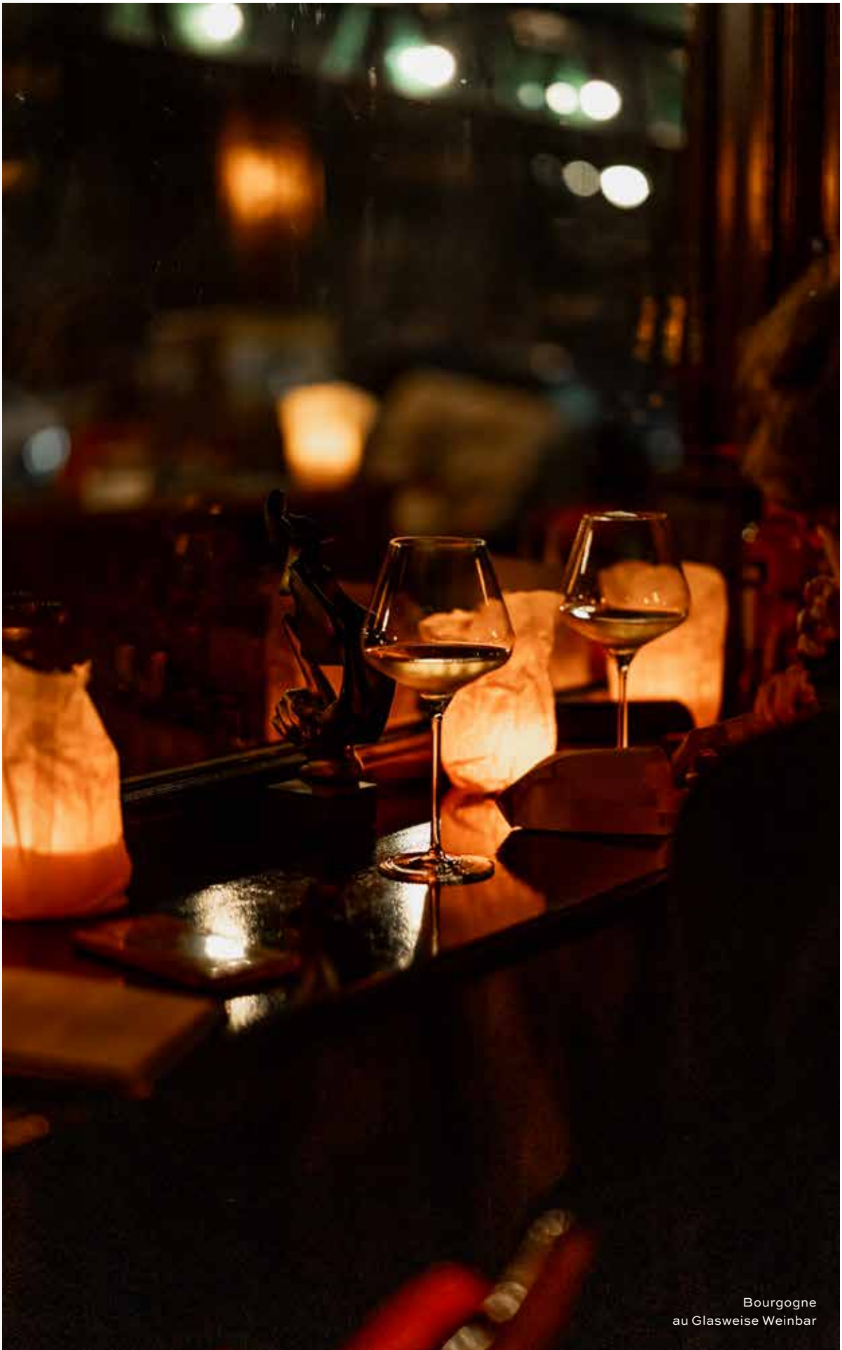
Bourgogne au Glasweise Weinbar