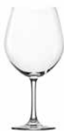
200 00 00 Bourgogne 770 ml H 216 mm Ø 109 mm € 42,40