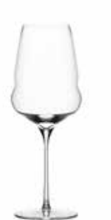
471 00 01 Vin rouge 609 ml H 251 mm Ø 94 mm € 73,14