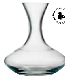
100 00 59* Carafe 750 ml H 213 mm Ø 194 mm € 26,74