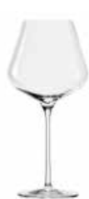
231 00 00 Bourgogne 710 ml H 245 mm Ø 116 mm € 52,30

Avec QUATROPHIL, Stölzle Lausitz témoigne de son haut niveau de compétence dans la production de verre machine extravagant sans sacrifier la robustesse, l'élégance et la fonctionnalité des verres.