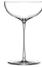
346 00 25 Kyoto Verre à Cocktail 318 ml H 172,2 mm Ø 112 mm € 52,30 NEW