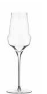
471 00 29 Flûte à Champagne 340 ml H 255 mm Ø 77 mm € 72,30