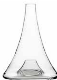
403 00 59 Erebus 1500 ml H 295 mm Ø 222 mm € 55,60