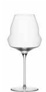
471 00 00 Bourgogne 712 ml H 245,5 mm Ø 111 mm € 75,64

L'accent mis sur les propriétés sensorielles du verre a donné naissance à un design contemporain distinctif qui se démarque des verres à vin traditionnels. Le design épuré, associé à sa construction légère, à sa jambe fine et à ses parois minces, reflète la précision et l'innovation dédiées à son développement. Des verres qui séduisent comme s'ils étaient soufflés à la bouche.