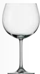
100 00 00 Bourgogne 650 ml H 205,5 mm Ø 108 mm € 34,08