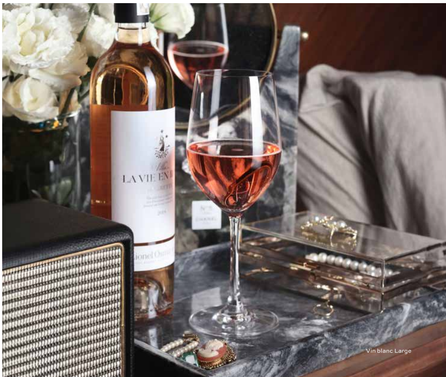
Vin blanc Large

Les verres sont volontairement soufflés plus épais. Cela les rend extrêmement robustes et, grâce à la combinaison de la forme classique et de la solidité, ils figurent parmi les classiques les plus appréciés sur les tables du monde entier.