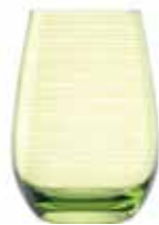
352 00 12 TW006 Vert 465 ml H 120 mm Ø 85 mm €47,92

Ceux qui ne souhaitent pas utiliser ces gobelets attrayants uniquement pour les boissons peuvent également les utiliser comme lanternes pour un éclairage atmosphérique.