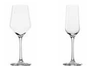
377 00 02 Vin blanc 365 ml H 220 mm Ø 82 mm € 29,60