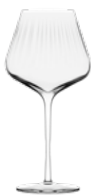
731 00 00 Bourgogne 710 ml H 245 mm Ø 116 mm € 57,62

Grâce à un processus technique sophistiqué, inspiré des techniques traditionnelles de soufflage du verre, la série émerge sans couture, caractérisée par un équilibre parfait - une symphonie d'élégance et de design pour un plaisir ultime. Les parois fines en verre de la série Symphony, ornées de délicates textures verticales, confèrent non seulement à la collection une touche esthétique mais créent également une surface intérieure élargie. Cela permet au vin de mieux respirer, dévoilant tout son spectre de saveurs. Les jambes étirées des verres assurent une élégance distinctive et une résistance remarquable à la casse.