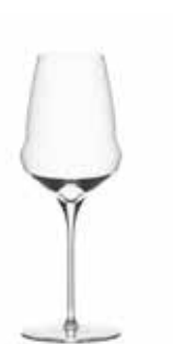
471 00 02 Vin blanc 483 ml H 242 mm Ø 88 mm € 70,22