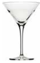
140 00 25 Grandezza Verre à Cocktail 240 ml H 172 mm Ø 116 mm € 47,38