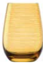
352 00 12 TW015 Ambre 465 ml H 120 mm Ø 85 mm € 47,92