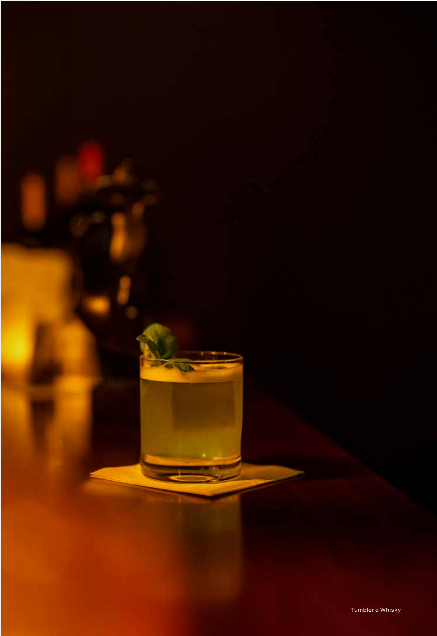
Tumbler à Whisky