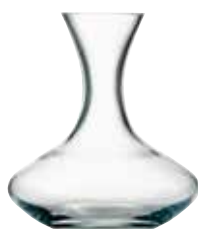
100 00 59 Weinland 750 ml H 213 mm Ø 194 mm € 26,74