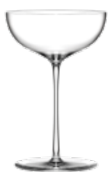
346 00 25 Verre à Cocktail 318 ml H 172,2 mm Ø 112 mm € 52,30