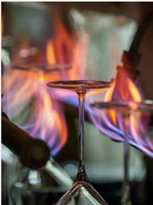
De l'idée à la production