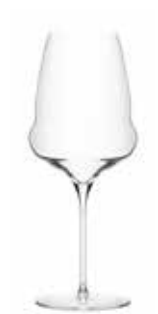
471 00 35 Bordeaux 746 ml H 259 mm Ø 105 mm € 75,64