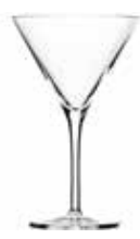
205 00 25 Professional Verre à Cocktail 250 ml H 168 mm Ø 106 mm € 37,18