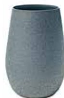
352 00 12 SN150 Galet (gris clair) 465 ml H 120 mm Ø 85 mm € 53,54

Tous les verres de la série STONES sont revêtus à l'extérieur avec de l'encre organique et sont résistants au lave-vaisselle.