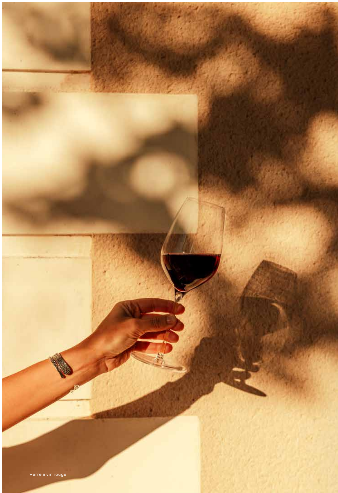
Verre à vin rouge