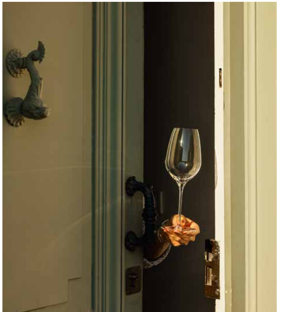
Flûte à Champagne Vin blanc Vin rouge